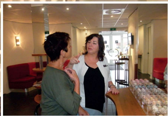
Advies voor de make-up met BeMineral.